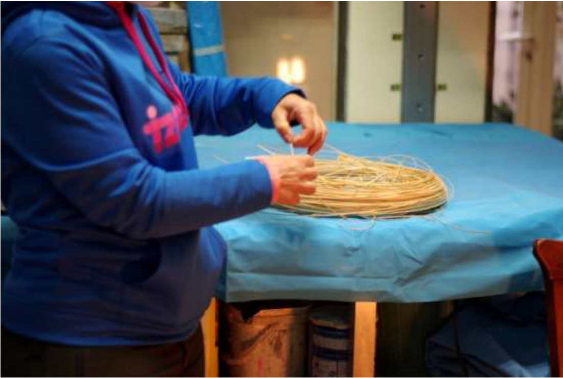
Maria de Cathedra, restauració de cadires