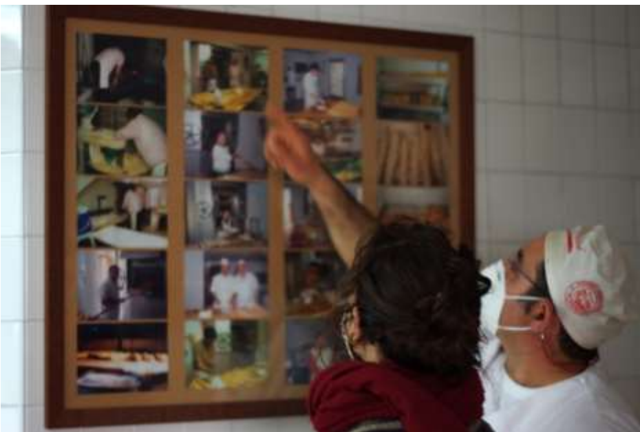
Forn de Jaraguas